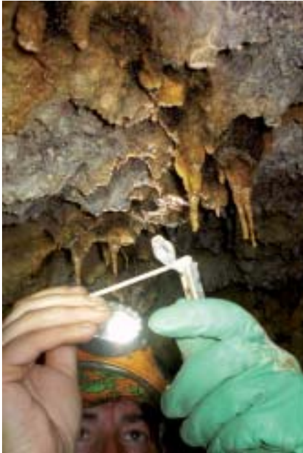
Ana Hetereki kobazuloko mukolito horia.

Argazkien bidez jaso dugu kobetako hainbat informazio. Alde batetik, tutu bolkanikoen barrualdea. Beste alde batetik, aurkitutako arrasto antropologikoak: giza hezurak, obsidianazko gezi-puntak, labanak eta bestelako tresnak, morteroak, kiera (gorputza margotzeko pinturak), petroglifoak, piktografiak (arrokan egindako pinturak) eta abar. Arrasto horiek guztiak aurkitu diren tokian bertan uztea komeni da, egunen batean ikertu bailitezke. Mugituz gero, ordea, galdu egingo litzateke informazioa. Eta, azkenik, kobetan sortzen diren espeleotemak edo egiturak; hau da, estalaktita, estalagmita eta bestelako egiturak.