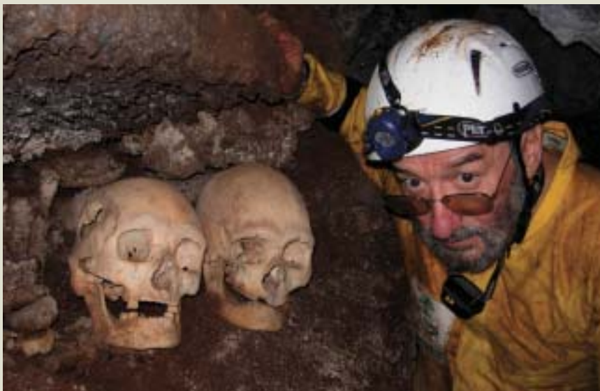
Roiho kobazulo-sistemako koba, bizitzeko erabilia, hango sarreran dauden giza hezurrekin.

Laburbilduz, Rapa Nuiko tutu bolkanikoetako urak gehienbat sodio eta/edo magnesio kloruratuak dira. Profil horren nagusitasuna dela eta, ondokoa ondoriozta dezakegu: urak gehienbat euri-uretan du jatorria (uhartean ez dago errekarik), ur-mota horren kloruro-profil bera baitu. Horrez gain, tutu bolkanikoetako uraren konposizioak arrokaren osagaiak barneratzen ditu, hala nola silizea, burdina eta nitratoak. Azaletik iragazten den euri-ura, tutu bolkanikoen barneraino sartu eta kobazuloko paretetan tanta lodi gisa kondentsatzen denean, barruko hezetasuna handitu egiten da, eta, ondorioz, metatu egiten da ura kobazulo barruan. Ez dago desberdintasun handirik kobazulo batzuetatik bes-