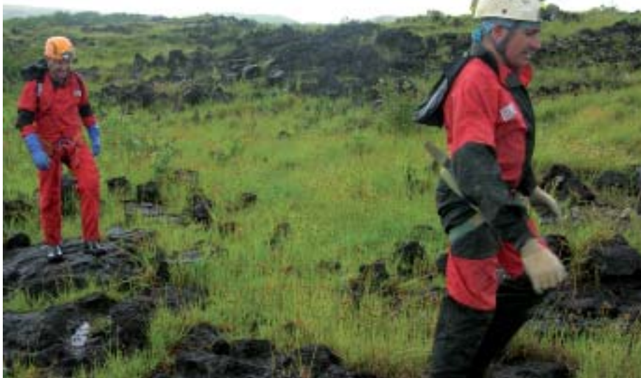
Ez da erraza sail bolkanikoan jameoak aurkitzea, paisaian aske dauden arroka beltzez eta gorrixkaz osatutako eremu zabala baita.

Roihoko tutu bolkanikoak koba estuz josita daude. Koben barrura sartzeko ahoak ( jameoak ) sail bolkanikoan zehar sakabana-tuta daude. Batzuetan ez da erraza jameoak aurkitzea, paisaian aske dauden arroka beltzez eta gorrixkaz osatutako eremu zabala baita. Ordu askoko ibilbideak egin behar izan ditugu, espeleologiako materiala gainean generamala, zuloak bilatzen eta GPSan beren erreferentziak sartzen. Baina, beste batzuetan, sail bolkanikora begiratu, eta oso ondo ikusten dira, bertatik zuhaitzak hazten baitira, eta hor behean zulo bat dagoen seinale da (zuhaitzak zulo horietan hazten dira, zuloetan hezetasuna hobeto manten-