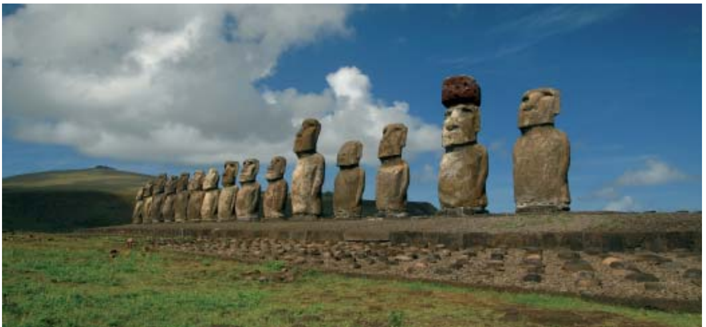
Tongarikiko moaiak aurrealdean, Poike sumendia atzealdean.