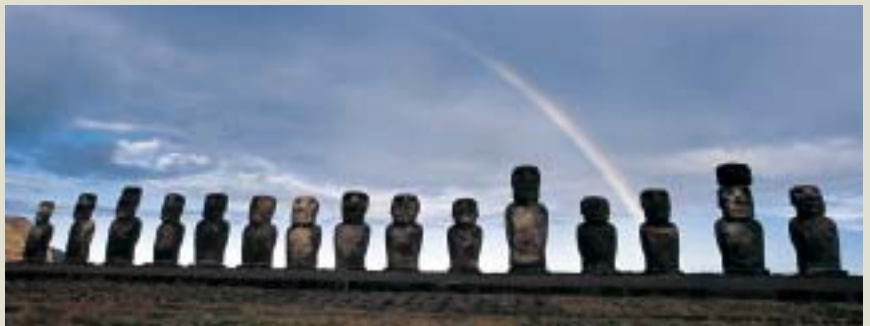
Ortzadarra Tongarikiko moaien gainean.

Eta kobekin lotuta, ikasi genuen lehenengo gauza izan zen rapanuitarrentzat kobak sakratuak zirela (ez baitiote inori uzten kobetan sartzen, haientzat tabu direlako), eta ezin ginela baimenik gabe kobetara sartu, bestela Aku Akuak (kobetako izpirituak) kontra izango baikenituen. Beraz, irlara heldu ginenean erritu sakratu bat egin ziguten Zaharren Kontseilukoek, Umu Tahu izenekoa. Erritu horren barruan, kuranto berezi bat prestatu ziguten ( kurantoa janaria prestatzeko era tradizionala da, eta janaria lur azpian egosten dute, aurretik harri bolkanikoak gori-gori jarrita). Egun magikoa izan zen, eta janari goxo-goxoak dastatu genituen, aparteko giro zoragarrian. Hurrengo egunean, Aku Akuen baimena genuela jakiteko, ortzadarra atera behar zen zeruan. Eta, kasualitatez —ala Aku Akuek horrela agindu zutelako, batek daki— ortzadar zoragarria agertu zen; beraz, Aku Akuen baimena genuenez, Zaharren Kontseiluaren baimena ere lortu genuen, eta lasai asko ekin genion lanari.