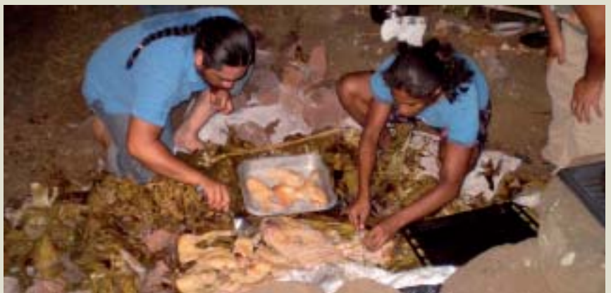
Umu Tahu ( kuranto errituala) prestatzen.