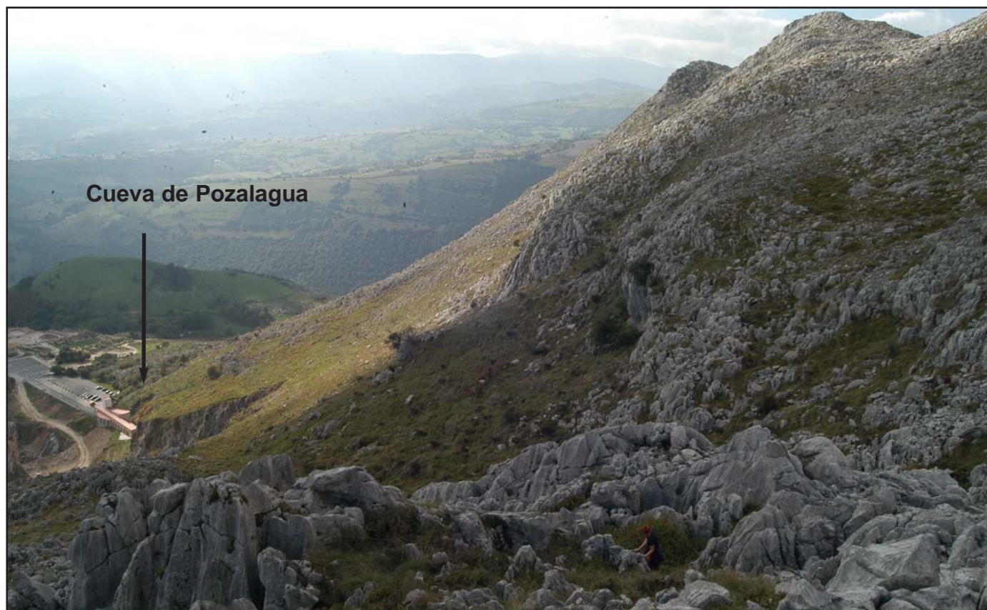
Peñas de Ranero y Cueva de Pozalagua.

La cavidad, es utilizada desde 1990 con fines turísticos llegando a tener más de 30.000 visitantes anuales. Estas visitas traen consigo una degradación progresiva de la cavidad, de tal modo que en los últimos años han sido perceptibles grandes descalcificaciones, originadas en formaciones secundarias como consecuencia de la aparición de hongos y líquenes, debido al incremento de temperatura, Co2 y por el calor que producen los focos.