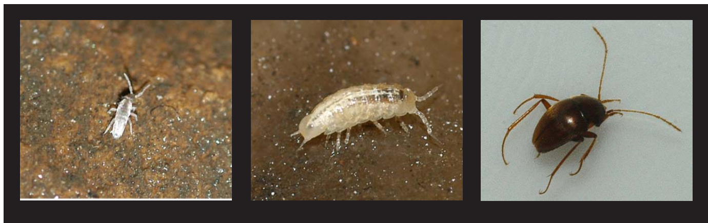
Colembolo, Isópodo y Coleptero de la cueva de Pozalagua.