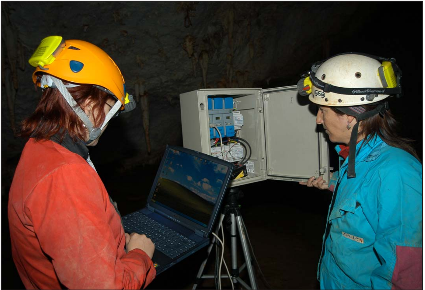
Recogida de datos climáticos de la estación subterránea de Versailles.

Para el control del análisis del agua de infiltración, se han ubicado tres pluviómetros que registran diariamente en milímetros, la media diaria y el total.