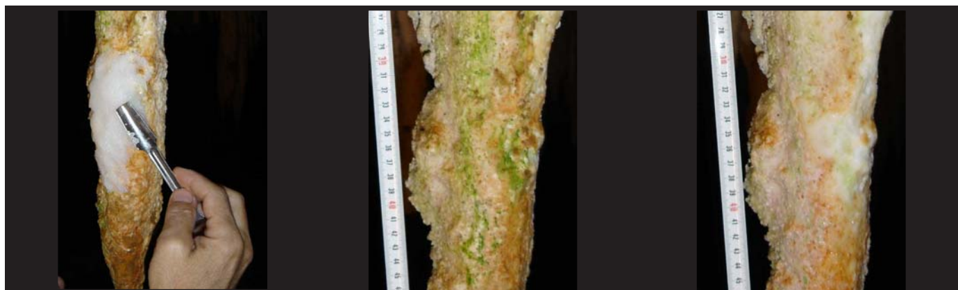
Eliminación de hongos a través de Resinas de intercambio iónico.

En la primera fase de la prueba, el éxito ha sido rotundo, llegando a eliminar en diversas formaciones elegidas para este estudio líquenes y hongos, sin llegar a las fases finales de la aplicación. El producto inventado por el Departamento de Química Analítica (UPV), se creó sobre todo para la roca calcárea pero es aplicable a diferentes tipos de composición, (arenisca, barro, granito, etc...).