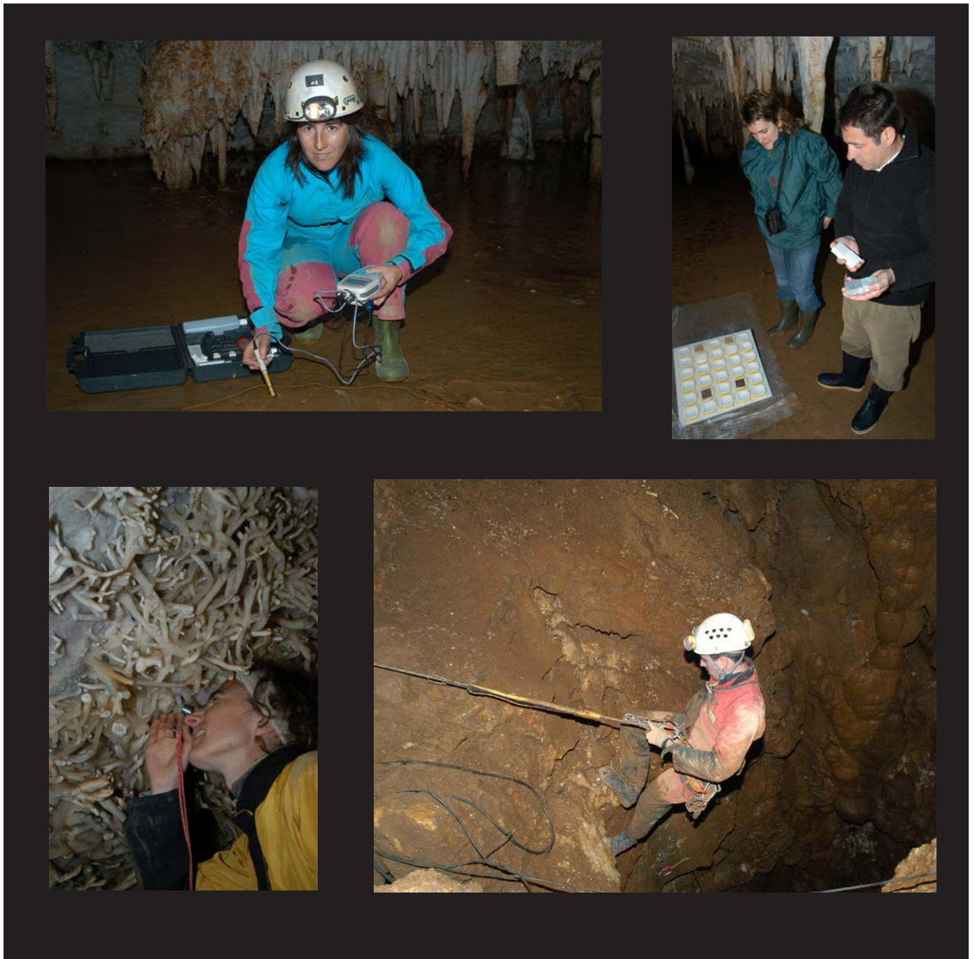
Investigadores participantes en el estudio de la Cueva de Pozalagua.

Como proyectos para 2005-2006 se ha pensado en incrementar el instrumental en el interior de la cavidad, con la instalación de medidores de Gas Radón y un Sismógrafo. Con ello se pretende estudiar nuevos parámetros que sin duda aportarán novedosos datos al estudio, ya que existe una cantera en funcionamiento en las cercanías que presumiblemente está produciendo fracturas en el interior de la cueva y con el sismógrafo se podrá controlar hasta que punto, es transmitida la onda expansiva de las voladuras y su afección en Pozalagua.