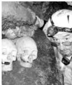
Una treintena de osamentas humanas encontraron los expertos.

En esta caverna se hallaron 10 petroglifos sobre la deidad Make Make, en la mitología de Rapa Nui, el creador del mundo.