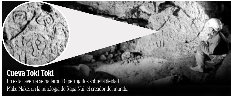
Cueva Toki Toki